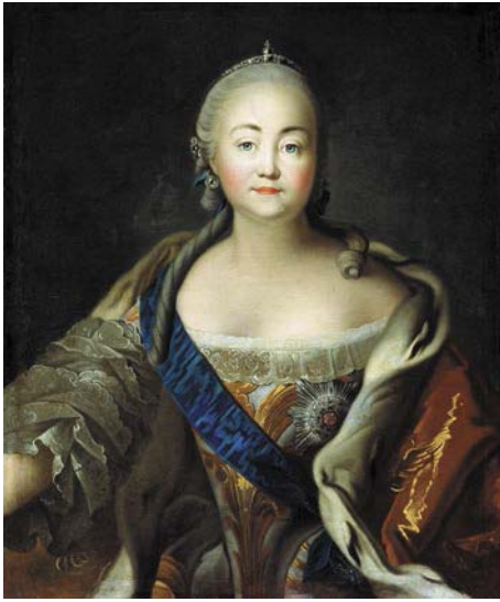
И.П. Аргунов. Портрет императрицы Елизаветы Петровны. Конец 1750–1760-е гг. Холст, масло. 86,0 x 71,0. Московский музей-усадьба Останкино