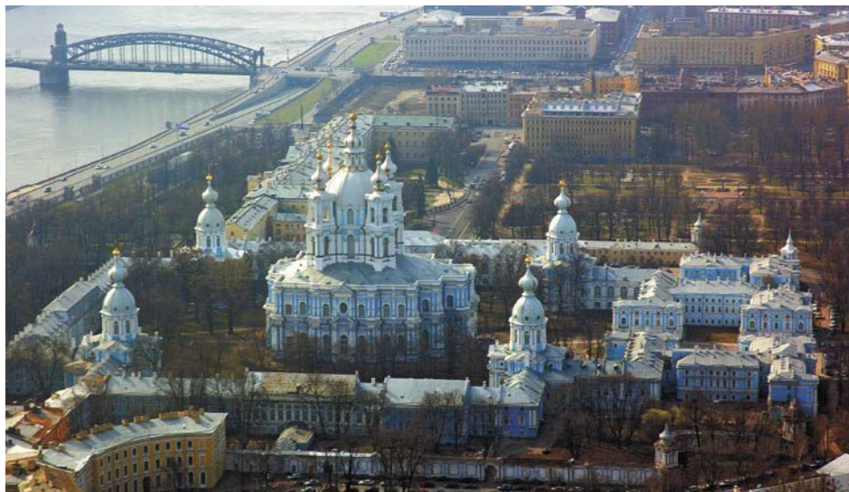
Смольный Воскресенский монастырь в Санкт-Петербурге Арх. Б. Растрелли

переведена в дом коменданта крепости. Состоялось следствие, которое производил фельдмаршал князь Александр Михайлович Голицын. Екатерина II добивалась от заключенной только правды относительно ее происхождения.