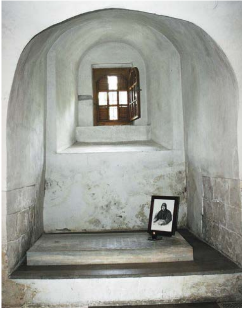
Гробница старицы Досифеи (принцессы Августы Таракановой) в усыпальнице Романовых. Новоспаский монастырь. Фото 2010 г.

Томского и преподобной Софии Суздальской имеют некоторые пересечения с житием старицы Досифеи и указывают на возможность прославления подвижника в случае наличия исторических преданий о его жизни и свидетельств о внешних побуждениях к монашескому постригу.