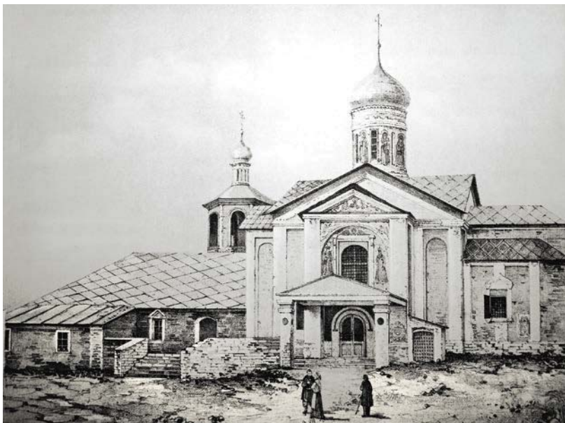
Церковь Усекновения главы Иоанна Предтечи под Бором на Куллишках. Вид с юга. Рис. А.А. Мартынова. Сер. XIX в.

монастыре. Оттуда мы узнаем, что принцесса Августа Тараканова «во иноцех Досифея» пострижена в Московском Ивановском монастыре.