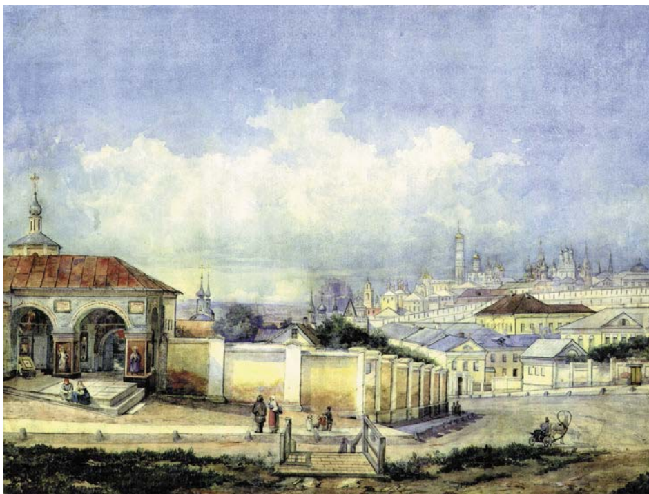
Вид Москвы от Ивановского монастыря. Акварель Д. Карташева. 1850-е годы. ИЗО ГИМ

Конференция посвящена памяти подвижницы и затворницы Ивановского монастыря старице Досифее (1745/46–1810). В феврале 2020 г. исполнилось ровно 210 лет со дня блаженной кончины подвижницы. Почила старица в Ивановском монастыре в своей келье у Святых врат с надвратным Казанским храмом 4 февраля (по ст. ст.) 1810 г. В этой келье монахиня Досифея прожила почти безвыходно около 25-ти лет. Началась ее подвижническая жизнь с резкой перемены судьбы, можно сказать, с заключения, но проходила в глубоком смирении, молитве и преданности воле Божией, последние годы она никого не принимала и пребывала в полном, добровольном уединении. Таким образом, ее заключение стало затвором, а ее смиреннейшая душа — преподобной. Свидетелей ее жизни было немало и раньше, а теперь, благодаря исследованиям в архивах, выявляются все новые и новые документы и свидетельства.